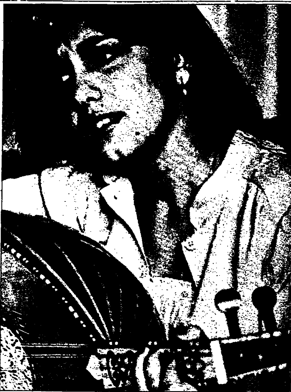
مع الفنانة ماجدة الرومي في حفلها الأخير في بيروت .

■ هناك مشاريع كثيرة قيد التحضير يقوم بها الكاتب الفني الذي يحمل اسمي ولكن ليس فيه اشياء جاهزة في الوقت الحاضر ، كل المشاريع ندرسها لكي تكون على مستوى طموحي ، واستطيع ان اتفق الناس بي وبشيء . ■ كان هناك مشروع للتزويج